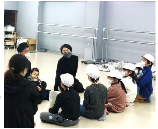
スタジオでじっくりお話を聞きました

10月26日(水)に2年生は堀出神社とにいつ鉄道商店街の11店舗に出かけました。まずは付き添ってくださる12名のボランティアさんにあいさつをして、さあ出発です。訪問先では、元気な「お願いします。」の後、順番に質問をして様々な人と関わることができました。ボランティアさんからは「準備してきた質問をしっかりとっていました。」「すれ違う町の人にもあいさつをしてえらいです。」とのお声をいただきました。このように子どもたちは自分の住む町を探検して興味や関心をもつことができます。ご協力いただきましたみなさん、本当にありがとうございました。