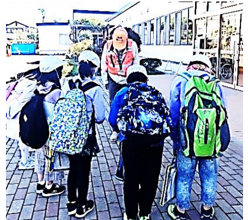
終わりのあいさつもしっかりできました